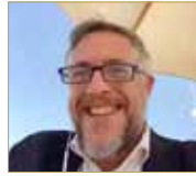
سفير الاتحاد الأوروبي

ونحو تحقيق الاستقرار في الشرق الأوسط، يرى السفير سيمونت في محور