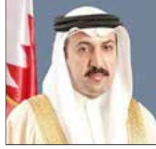
د. الشيخ عبدالله بن أحمد آل خليفة

مستويات الاستقرار الاجتماعي. وبيئت الأنصاري أن الترابط العائلي يعد مؤشر «خط أساس» ضمن الخطة الوطنية لنهوض المرأة البحرينية (2013-2022) ويرتبط بشكل مباشر بمجال استقرار الأسرة، كذلك الإطار الموحد لخدمات الإرشاد والتوعية