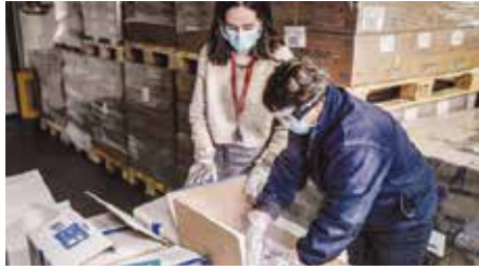
وصول دفعة من لقاح فايزر- بايونتيك، إلى باريس.

٢٤ مليوناً على مستوى البلاد. كلفه فرنت التمسك شايير إلماخ في سبوتيل البلاد أسس لخدمة الخاتمة منذ بدء تفشي الفيروس.