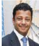
جمال فارس الرويعي.

أكدت مملكة البحرين أن الادعاءات القطرية الباطلة بشأن قيام أربع طائرات مقاتلة بحرينية باختراق الأجواء القطرية يوم الأربعاء الموافق 9 ديسمبر 2020 أمر مؤسف وعار من الصحة ولا يمت إلى الحقيقة بصلة. وأوضحت في رسالة وجهها للشعب القطري الدائم لمملكة البحرين لدى الأمم المتحدة السفير جمال فارس الرويعي إلى كل من رئيس مجلس الأمن والأمين العام للأمم المتحدة أن ادعاءات دولة قطر الباطلة هي -لأسف- جزء من الممارسات المستمرة والمتصاعدة التي تمارسه دولة قطر بهدف زعزعة الأمن والاستقرار، ومن ثم تقاوم التورات الإقليمية، إذ توضح مثل هذه التصرفات عدم المصداقية