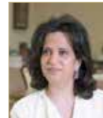
الشيخة مي بنت محمد

أشارت رئيسة هيئة البحرين للثقافة والآثار الشيخة مي بنت محمد آل خليفة إلى إن الخطاب السامي لعاهل البلاد صاحب الجلالة الملك حمد بن عيسى آل خليفة يعكس ما توليه قيادة ملكة البحرين الرشيدة من ثقة للوطن البحريني ودعم للمرأة البحرينية لدورها في المساهمة في النهضة الاجتماعية والاقتصادية والثقافية في المملكة، متوجهة بالتهنئة إلى كافة الكوادر الشرطية النسائية بمناسبة مرور 50 عاماً على تأسيس الشرطة النسائية البحرينية. وأكدت أن فضل النجاح الذي