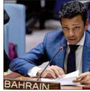
السفير جمال فارس الرويحي

خارجية مملكة البحرين بتاريخ 24 ديسمبر 2020م، الذي يوضح أنه في يوم الأربعاء الموافق 9 ديسمبر 2020م، وفي أثناء تنفيذ طلعة جوية تدريبية مشتركة لطائرتين (F-16) تابعتين لسلاح الجو الملكي البحريني وطائرتين من نفس النوع تابعتين لسلاح الجو الأمريكي في منطقة التدريب المخصصة في أجواء المملكة العربية السعودية الشقيقة، وذلك ضمن التمرين الجوي المشترك بين السلاحين الصديقين، وبعد قرب انتهاء الوقت المخصص للطلعة الجوية عند الساعة 15:50 بتوقيت مملكة البحرين، قامت الطائرات الأربع بالاندماج في تشكيل واحد ومن ثم التوجه إلى أجواء مملكة البحرين عبوراً بأجواء المملكة العربية السعودية باتجاه الشرق استعداداً للهبوط بقاعدة عيسى الجوية، حيث إن هذا المسار يعتبر المر الجوى للخروج من منطقة التدريب والدخول إلى أجواء مملكة البحرين، ولم يؤد بالطائرات الأربع إلى الأراضي القطرية، ولم يتم دخول المجال الجوي القطري، وإن سلاح الجو الملكي