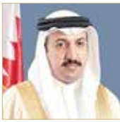
الشيخ عبدالله بن أحمد

النهج الإصلاحي الشامل لحضرة صاحب الجلالة الملك حمد بن عيسى آل خليفة عاهل البلاد المفدى، في تعزيز شراكة المرأة في المجتمع، وبيان إسهاماتها الناجحة في مختلف المجالات، وذلك الصبغة المصرية. مضافاً: إن البرامج التوعوية والمبتكرة التي تنبأها الحكومة برئاسة صاحب السمو الملكي الأمير سلمان بن حمد آل خليفة، ولي العهد رئيس الوزراء، تستهدف الإرتقاء الدائم بواقع المرأة، والاستثمار الذكي في العصر الشري.