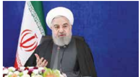
روحاني يتحدث خلال اجتماع للجنة المعنية بمكافحة كورونا.

حيث يقول مالينا، مؤكداً أن هذا البلد الذي لم يسمه ورواحني إجره هذه العملية.